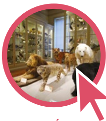
MUSÉUM D'HISTOIRE NATURELLE

07 72 34 20 50 museum.animation @ville-larochelle