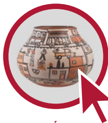
MUSÉE DU NOUVEAU MONDE

07 72 34 20 50 museum.animation @ville-larochelle