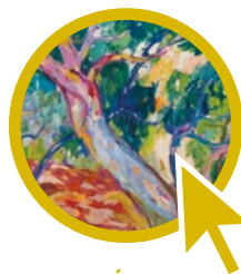
MUSÉE DES BEAUX ARTS

05 46 51 51 45 se-mah@ville-larochelle.fr