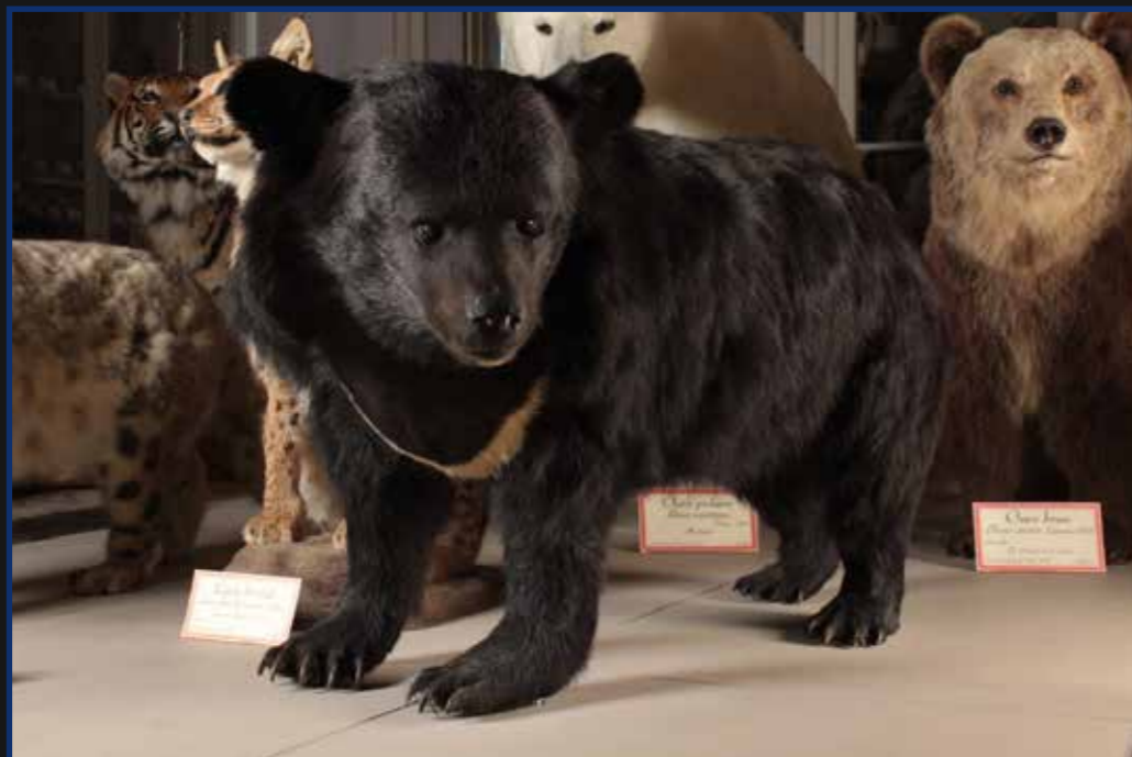
Ours du Tibet ( Ursus thibetanus ), collection Muséum d'Histoire naturelle du Muséum, inv. 2005.4.24