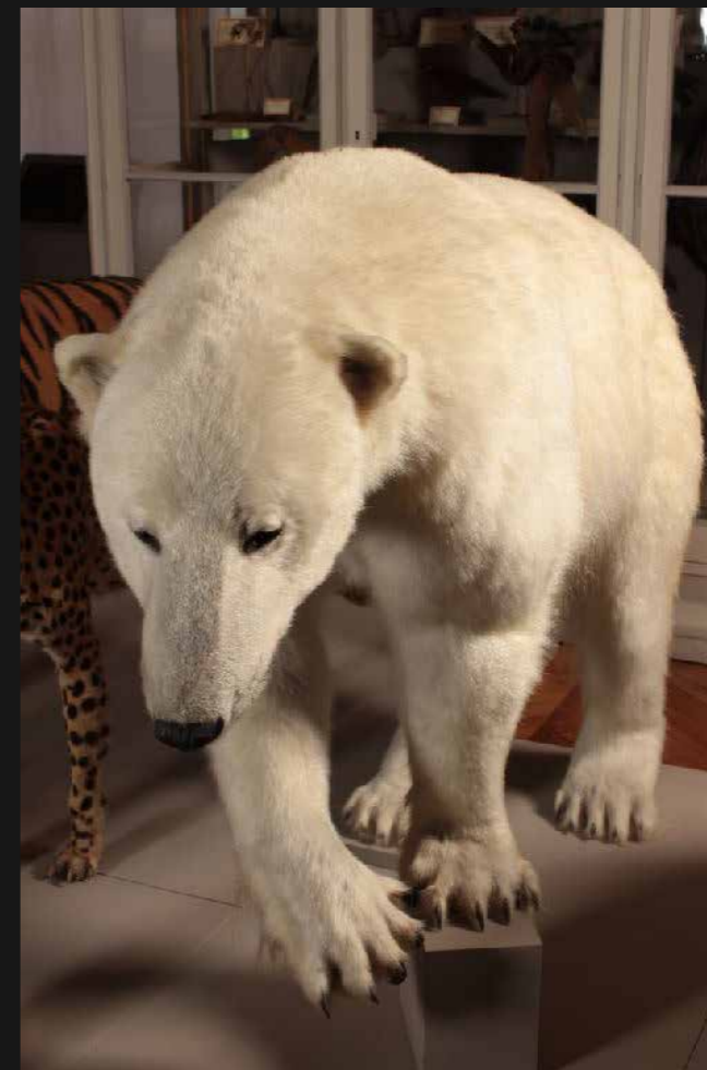
Ours blanc ( Ursus maritimus ) collection Muséum d'Histoire naturelle du Muséum, inv. M.1357