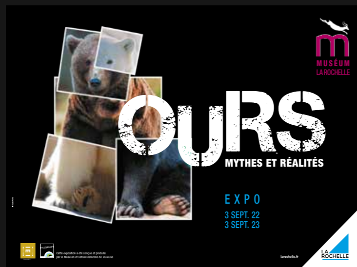
Affiches de l'exposition du Muséum de la Rochelle