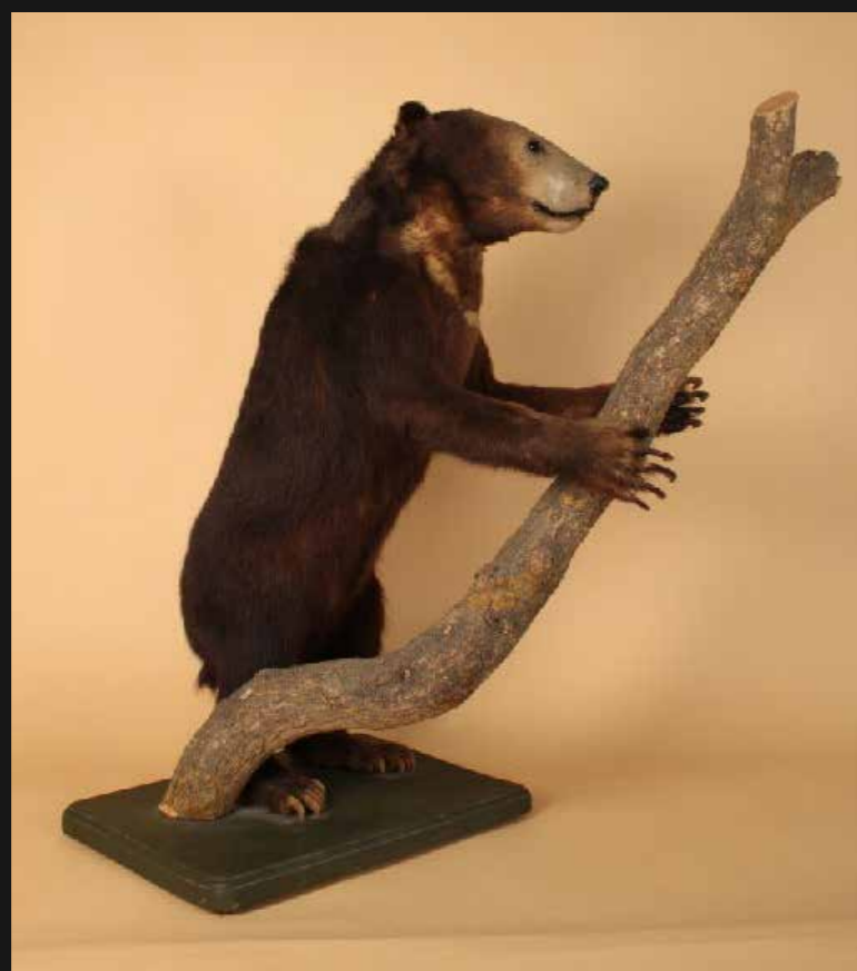
Ours malais ( Helarctos malayanus ) collection Muséum d'Histoire naturelle du Muséum, inv. M.554