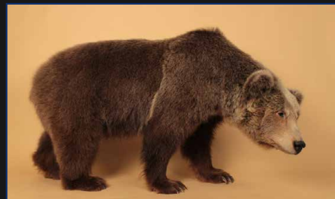
Ours brun ( Ursus arctos ) collection Muséum d'Histoire naturelle du Muséum, inv. M.1386